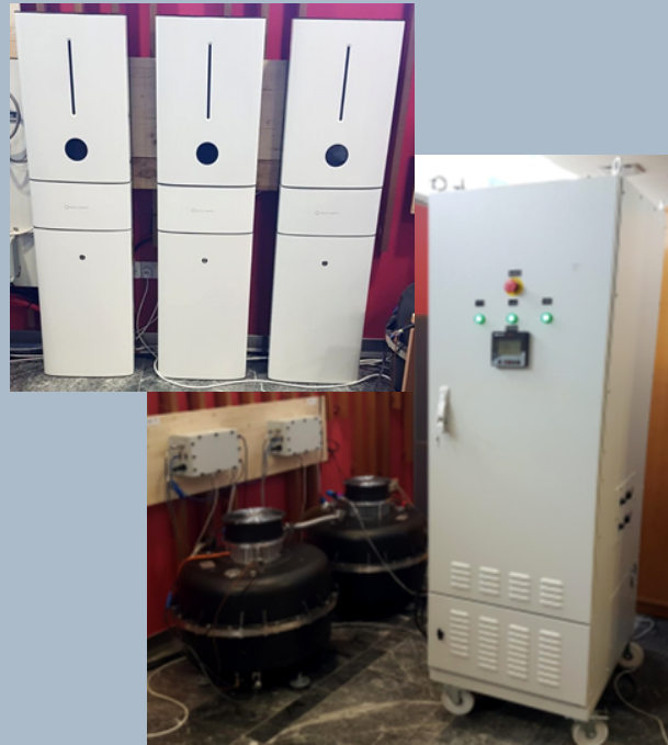
2ο Πιλοτικό: Σύστημα αποθήκευσης μπαταρίας & σφονδύλου στο Ερευνητικό Κέντρο ΚΟΙΟΣ