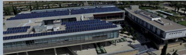
Φωτοβολταϊκά στην Πανεπιστημιούπολη του Πανεπιστημίου Κύπρου

Οι υπηρεσίες αυτές βελτιώνουν τη χρήση και την ποιότητα ισχύος του δικτύου, ενώ μειώνουν το κόστος ηλεκτρικής ενέργειας του καταναλωτή-προμηθευτή.