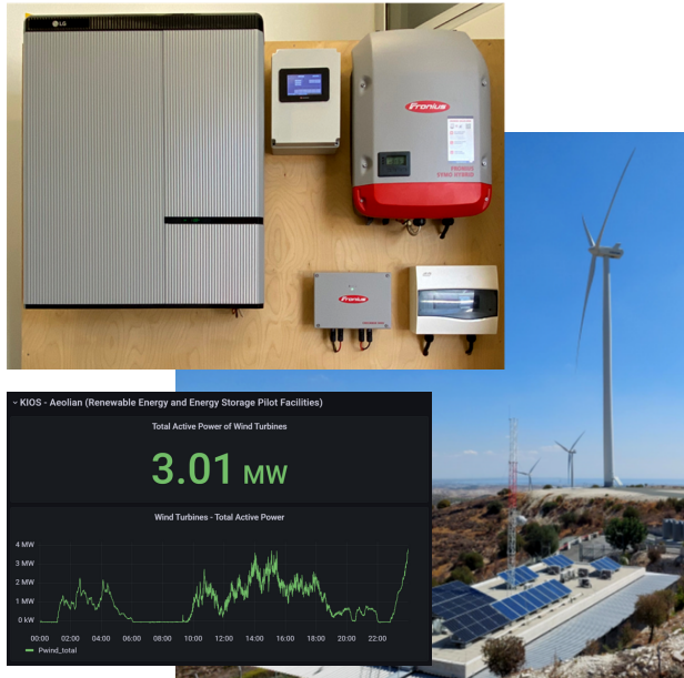
1ο Πιλοτικό: Σύστημα αποθήκευσης μπαταριών στην Aeolian Dynamics

Στο πρώτο πιλοτικό, ένα σύστημα αποθήκευσης μπαταριών έχει συνδεθεί με τον αιολικό και φωτοβολταϊκό σταθμό ηλεκτροπαραγωγής της Aeolian Dynamics, για να υποστηρίξει την ευστάθεια του δικτύου, αντισταθμίζοντας την απρόβλεπτη διακύμανση της ενέργειας που παράγεται από ανανεώσιμες.